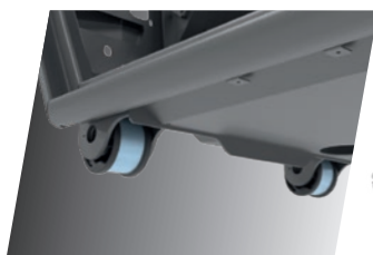
Silent Block delanteros

La cabina dispone de un sistema de amortiguación con regulación integrada, compuesto por 4 soportes que anulan los impactos y las sacudidas en todas las direcciones : laterales, verticales, posteriores y delanteras.